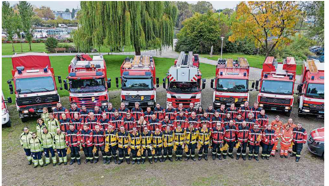
Die Angehörigen der Feuerwehr Kreuzlingen präsentieren sich und ihre Flotte mit Fahrzeugen.