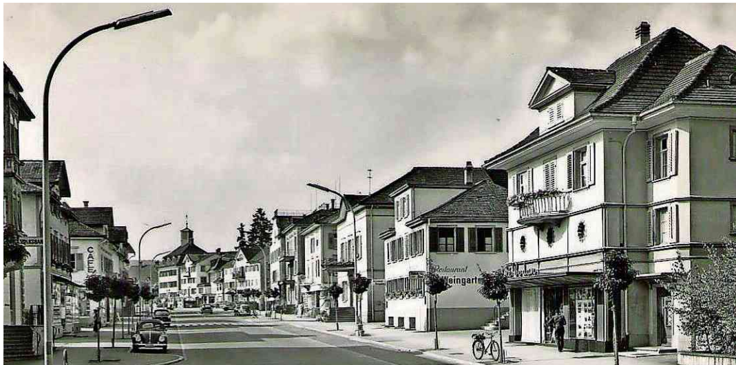
Die Hauptstrasse mit Kino Bodan und Restaurant Weingarten im Jahr 1955. Knapp zehn Jahre später entstand dort das Hotel Zentrum, das heutige Schlemmerzentrum.