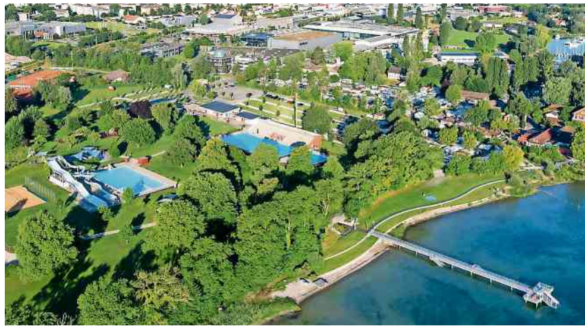
Der Saisonstart in der Badi Hörnli wird auf den 4. Mai verschoben.

Die umweltfreundliche Solarthermie-Heizung kann bei diesen Wetterbedingungen das Wasser in den Becken nicht aufheizen. Zurzeit beträgt die Wassertemperatur lediglich 10 Grad Celsius. Selbst mit der zur Verfügung stehenden Zusatzheizung wäre es schwierig, die Temperaturen im Becken auf 20°C Celsius anzuheben. Zudem würden innerhalb weniger Tage Energiekosten von über CHF 15'000.- entstehen. Dies erscheint der Stadt aus ökologischen, aber auch aus betriebswirtschaftlichen Überlegungen nicht sinnvoll. Die Entscheidung, den Saisonstart zu verschieben, fällt nicht leicht. Die Stadt und insbesondere das für das Schwimmbad Hörnli zuständige Departement Gesellschaft bittet für diese ungewöhnliche Massnahme um Verständnis.