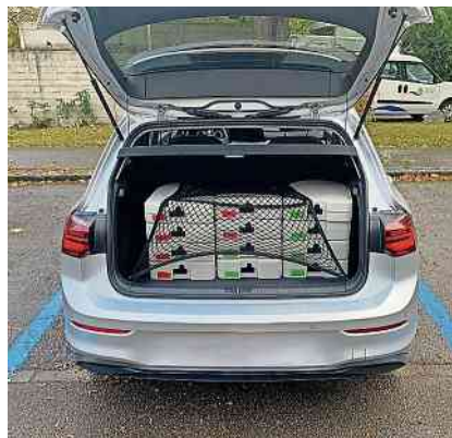
Kranke und betagte Menschen erhalten mit dem Mahlzeitendienst ihr Mittagessen.

Der Mahlzeitendienst See ist der offizielle Mahlzeitendienst der Stadt Kreuzlingen sowie der Gemeinden Bottighofen, Lengwil und Münsterlingen. Dank diesem wichtigen und sinnvollen Dienst erhalten betagte und kranke Menschen täglich in ihrem zu Hause ein Mittagessen.