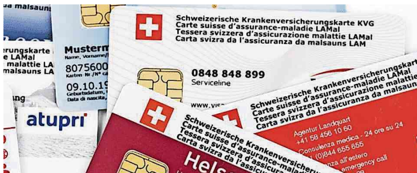
Wie weiter, wenn sich Schulden bei der Krankenkasse angehäuft haben?

Seit 2012 sieht das Krankenversicherungsgesetz vor, dass Personen, die fällige Prämien- oder Kostenbeteiligungen der Krankenversicherung nicht bezahlen, betrieben werden. Gleichzeitig werden sie auf die Liste der säumigen Prämienzahler gesetzt, in der Folge erhalten die Betroffenen nur noch medizinische Notfallbehandlungen. Häufen sich die Ausstände bei der Krankenversicherung, wird es immer schwieriger, die Schulden abzubauen und medizinische Leistungen zu bezie-